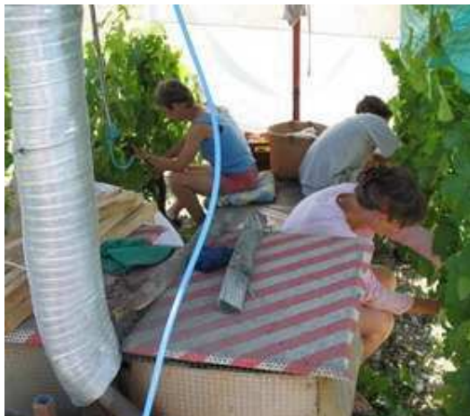
« échardage » en « Vitimobile »

Assurer un emploi régulier à notre personnel qualifié est un gage de pérennité de la qualité du travail effectué, et donc du plaisir que vous aurez à déguster nos vins. Le souci d'améliorer les conditions de travail, la confiance réciproque et le respect mutuel établis avec nos employés, permettent cette réalisation.